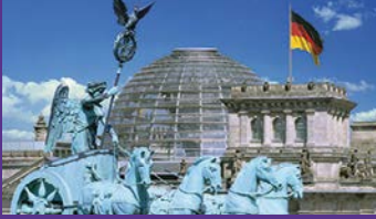
Quadriga vor der Reichstagskuppel