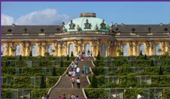
Schloss Sanssouci in Potsdam

Berlin-Brandenburg bietet passgenaue Förderprogramme für Innovationen, Investitionen und Fachkräftequalifizierung. Die Finanzierung erfolgt durch die Europäische Union, den Bund sowie die Länder Berlin und Brandenburg.