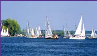
Hervorragende Freizeitmöglichkeiten in der Region

Die Region verbindet auf unvergleichliche Weise das internationale Flair der Metropole Berlin mit der faszinierenden Natur und den historischen Sehenswürdigkeiten Brandenburgs. Eine einmalige Clubszene, renommierte Großveranstaltungen, mehr als 170 Museen, 150 Bühnen sowie rund 500 Schlösser, Kirchen und Parkanlagen laden zum Besuch ein. Sportlichen Freizeitaktivitäten wie Golf, Reiten, Wassersport und Fliegen sind keine Grenzen gesetzt.